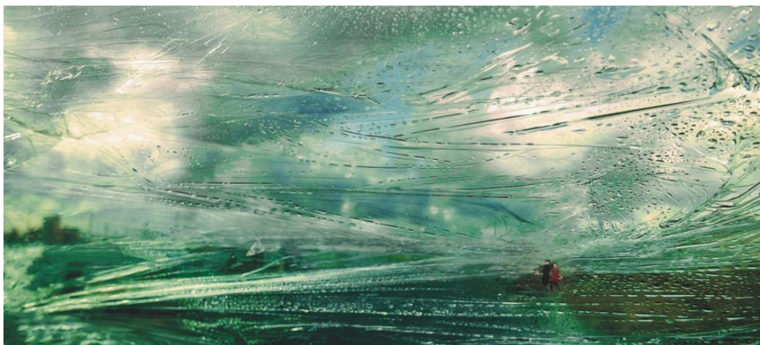
VOOG-39 - 18x40 - 2017