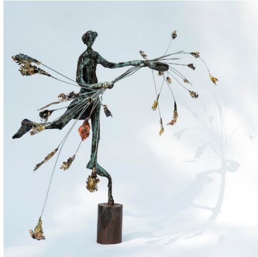
JONAAS - 679x138x40 - 2017

Le thème de Jonaas augmenté d'une voyelle et au-delà de sa mystique symbolique est dans cette perspective un prétexte ouvert à l'interprétation de l'acte de création.