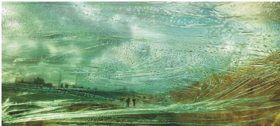
VOOG-38 - 18x40 - 2017